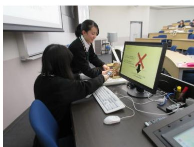
A班「がたがたもぐもぐ」 発表者：兵庫商業高校生2名

プレゼンテーションは、それぞれのアイデアをパソコンや試作品を使って説明し、工夫したところや苦労した経過など、一生懸命に発表しました。そしてアドバイザーの方からは、一班ずつ丁寧に質疑やアドバイスをいただきました。