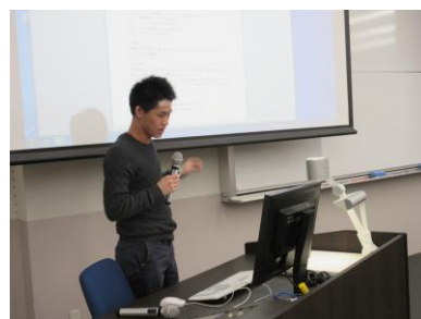
D班「ストラックアウトNOW」 発表者：流通科学大学生1名