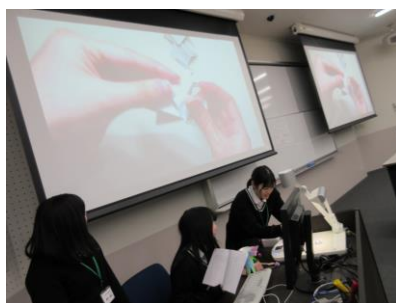
H班「キャッチだま」 発表者：兵庫商業高校生4名